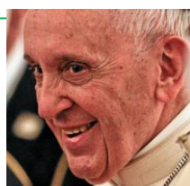
Pape François Panama City – 24 janvier 2019

"Se rencontrer ne signifie pas s'imiter, ni penser tous la même chose ou vivre tous de la même manière faisant et répétant les mêmes choses, écoutant la même musique ou portant le maillot de la même équipe de football. Non, pas ça. La culture de la rencontre est un appel et une invitation à oser garder vivant un rêve commun."