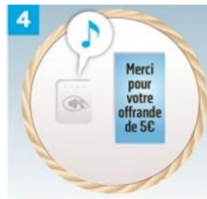
4 Un signal sonore indique que l'offrande a été prise en compte et l'écran affiche un message de remerciement . Le compte du donateur est débité dans les 24 heures .