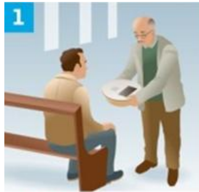
1 Un quêteur présente le panier à un fidèle .

Faites signe avec votre carte au "quêteur connecté" qui viendra vers vous. Puis laissez-vous guider.