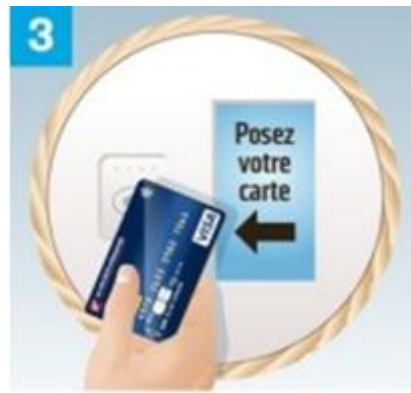
3 Il appose ensuite sa carte bancaire sur le lecteur sans contact . Le dispositif ne fonctionne qu'avec les cartes disposant d'une puce de paiement sans contact .