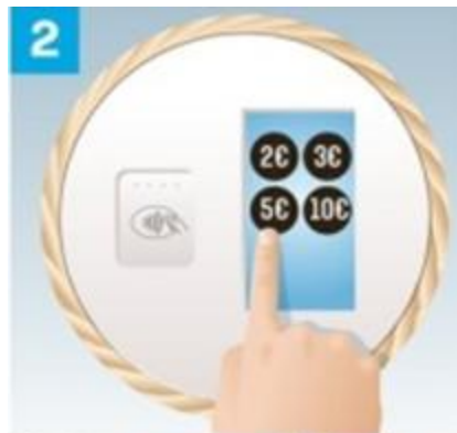
2 Plusieurs montants d'offrande sont proposés. Le donateur fait son choix en touchant l'écran .