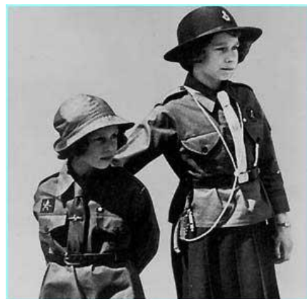
Princesse Elizabeth et princesse Margareth girl scouts