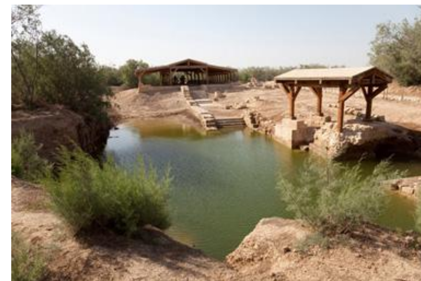
Béthanie-au-delà-du-Jourdain (Jordanie) Lieu choisi par l'Eglise pour faire mémoire du baptême du Christ.