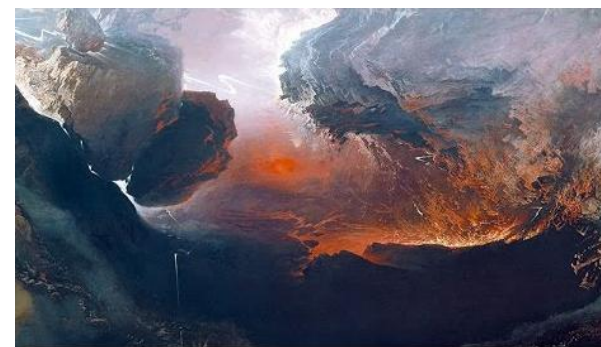
L'apocalypse par John Martin – Tate Londres

Durant le temps pascal, nous avons de nombreux textes tirés de l'apocalypse. Pour nos contemporains, le mot est synonyme de "fin du monde violente".