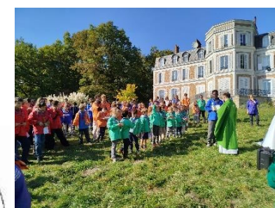
Avec les scouts, des camps, de la lumière