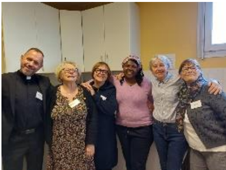
Table ouverte paroissiale, des équipes engagées, des jeunes au services