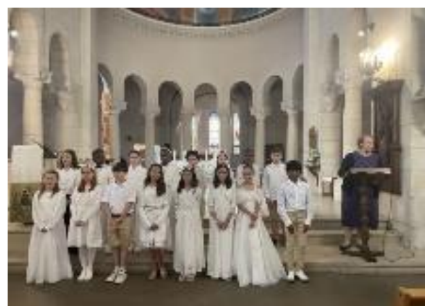
Des temps de prière, de vénération