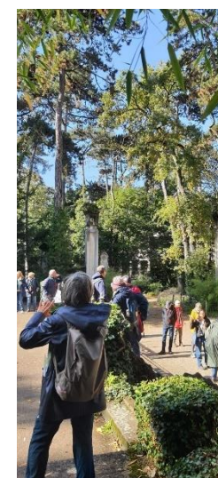
Des marches, des journées paroissiales, des pèlerinages