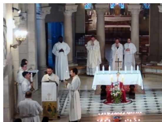
Saint Carlo Acutis