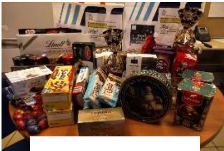
Dons des enfants du KT pour Saint Vincent de Paul