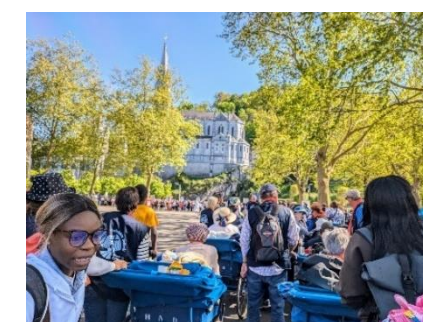
En avril, tous à Lourdes...