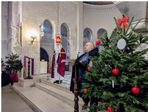
Fais ton Noël avec ambiance portugaise